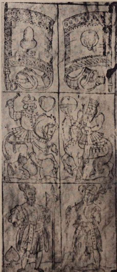
4. ábra. Részlet egy XVI. sz. végi 32 lapos német kártya-ívől. M. Tud. Akadémia könyvtára, Budapest.