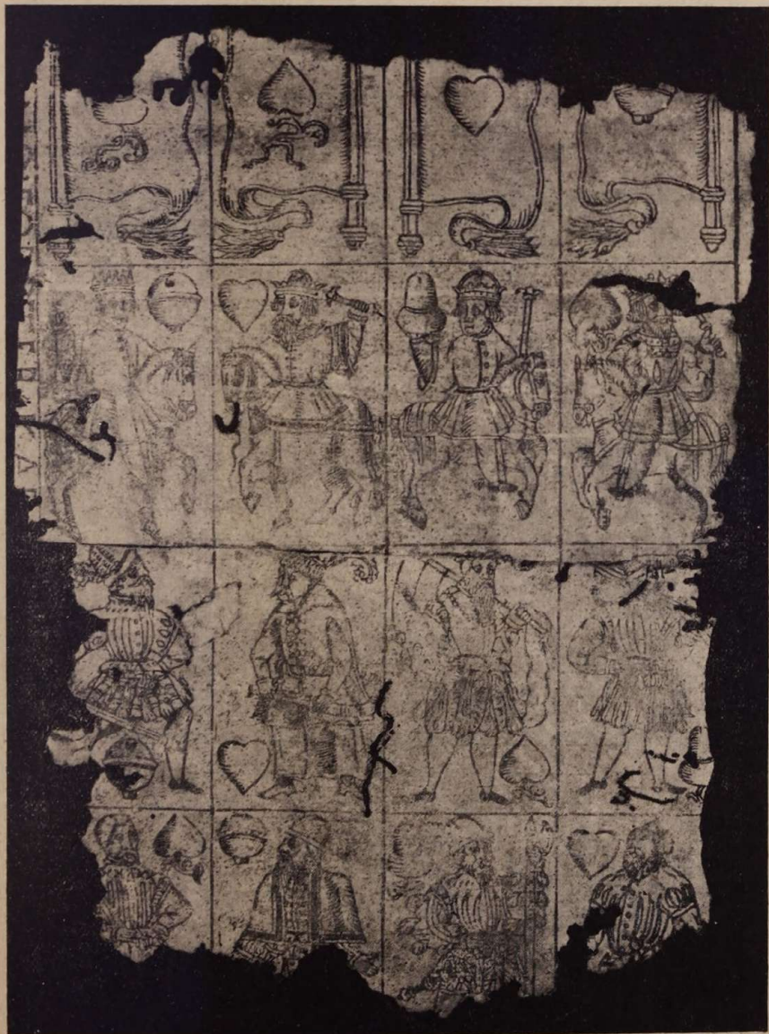
1. ábra. 32 lapos kártya csonka férlve. Készítette Hans Forster (Bécs). XVI. sz. közepe. — Városi múzeum, Kőszeg.

terekről a nyomatot, kemény papírra ragasztották, ha nem voltak színezve: kiszínezték (rendesen u. n. patronokkal), végül szétvágták és csomagokban forgalomba hozták.